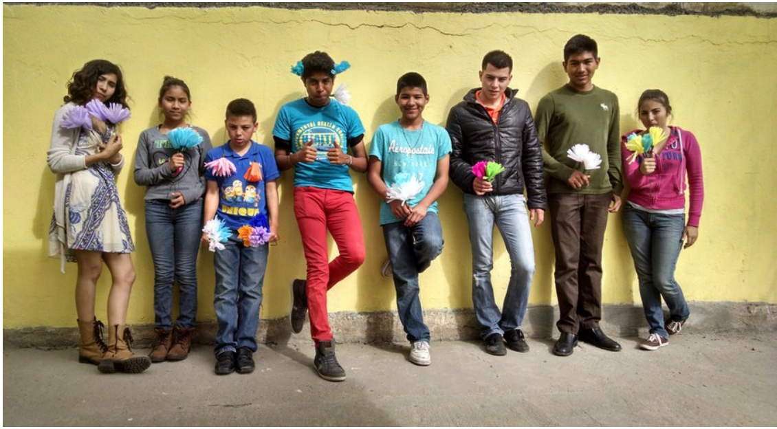
Jóvenes Pro Justicia Ambiental. Environmental Health Coalition

By Pablo J. Sáinz | 3:16 p.m. April 9, 2016