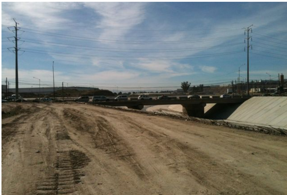
Canalización de tercera etapa de arroyo Alamar (Korina Sánchez S.)

A poco tiempo de que inicie la canalización de la tercera sección del arroyo Alamar, que conectará el tráfico binacional, hay activistas que se oponen a que se cubra la vegetación con concreto